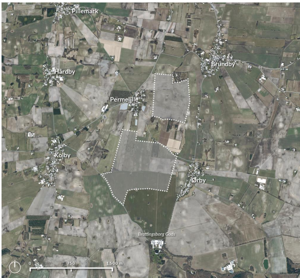
Figur 1: Oversigtskort der viser solcelleprojektets område markeret med hvid prikket linje og grå flade.

Plan- og projektområdet omfatter et areal på omkring 150 ha, som ligger i landzone og anvendes til landbrugsformål i form af dyrkede jorde. Arealerne skal forblive i landzone.